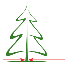
Celma diametrs nedrīkst pārsniegt 12 cm.